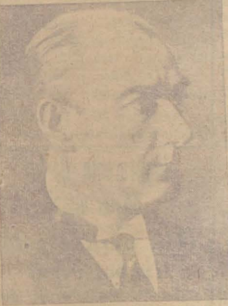
30 Ağustos zaferini yaratan asil Türk milletini medeniyet dünyasında lâyık olduğu mevkie çıkaran Büyük Şefe bin minnet ve şükran.

Yeni Mersin: Dünya tarihinin akışını değiştiren büyük zaferin yıldönümü münasebetile bu zaferi yaratan Atatürkü ve kahraman orduyu minnet ve şükranla selâmlar ve havacılık haftasını candan kutlar,